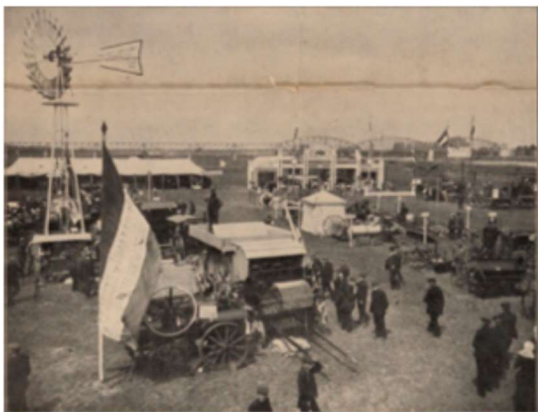
Deze foto van de provinciale landbouwtentoonstelling in 1909 op de Worp in Deventer geeft een idee hoe het er in 1897 in Voorst uitzag. Op de achtergrond de oude spoorbrug.

Op 30 juni 1897 was er een grote landbouwtentoonstelling bij de Zutphenboer in Voorst. De tentoonstelling werd georganiseerd door de afdeling 'Voorst en Wilp' van de Geldersch-Overijsselsche Maatschappij van Landbouw. Landbouwtentoonstellingen maakten aan het eind van de 19de eeuw een grote opgang in de IJsselstreek. Er waren in die tijd tentoonstellingen in Wijhe (1893 en 1896), Olst (1897 en 1905), Deventer (1900 en 1909), Nijbroek (1901), Epe (1905) en Diepenveen (1906). Het waren omvangrijke evenementen waar de producten van de land-