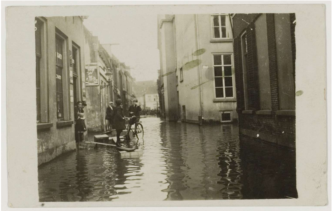
Hoogwater in de Dieserstraat te Zutphen 1926.

Er was in 1754 dus sprake van flink water in de binnenstad van Zutphen. Daarmee kan het ook zeker in 1651 zijn gebeurd, want toen was de waterstand zoals gezegd nog 27\frac{3}{4} duim, d.i. ongeveer 70 cm hoger. Toch is het niet volstrekt bewezen dat het water daadwerkelijk aan het Oude Bornhof stond. Er is geen rechtstreeks verslag van de gebeurtenissen. Ook de toenmalige jaarrekeningen van de stad Zutphen geven wat dat betreft geen definitief uitsluitel: er zijn weliswaar diverse uitgaven die naar het hoge water verwijzen, maar ze maken geen melding van bijvoorbeeld het leggen van vlonders in de straten of van herstelwerkzaamheden aan de poorten.