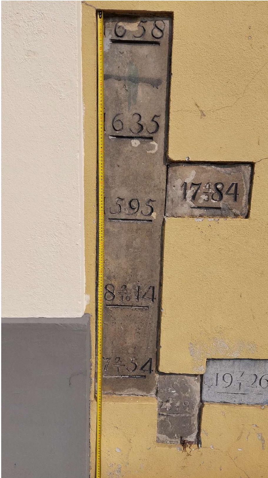
Gedenkstenen van hoogwater aan de Bokkingshang te Deventer.

De gedenkstenen laten zien dat hoogwater van alle tijden is. Het veelbeschreven, maar toch relatief bescheiden hoogwater van 1926 ligt een paar cm onder het niveau van 1754. Van het jaar 1651 is geen gedenksteen, maar wel van het ongeveer gelijke niveau van 1635. Foto 2024.